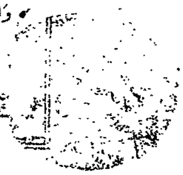
الصفحة الأخيرة من المخطوط

انه من لامثال ثم تفضض من ضرب اليد وخرج بابل من فوزه كساح وانواعه بن طاح انتهى قال ابو عبد الله العبد صغير اليه العتيق بن محمد بن ابي محمد بن ظفر مكي عفا الله عنه والحمد لله قد انتهت بعبة ما المرذت الى تهيئة ما اوردت وانا اعوذ بالله من عذاب الاعذاب كما اعوذ به من عذاب الاعجاب واستغنيه عن عول سلوان كما استغنيه من عول الجواب واستدفع به فساد الخطاب كما استدفع به كساد الضوب والتوب اليه فهو الرجم التواب ثم كتاب سلوان المطاع وعدواه الانتاج وهو الحمد وعونه